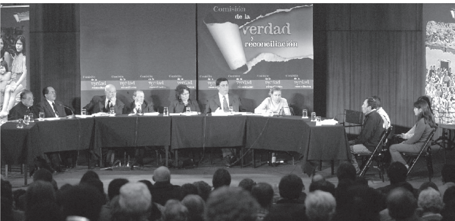
Grupo de comisionados escuchando a un testificante en el marco de la Audiencia Pública realizada en Ayacucho.

Uno de los sentidos comunes que rompió la CVR guarda relación con la cifra de los muertos y los desaparecidos: 69.280 personas, en contraste con un número de 25.000 que hasta entonces era la cifra oficial que el país manejaba. SL era, hasta entonces, responsable de más del 50% de estas muertes y desapariciones pero ni siquiera el Estado se preocupó de documentar lo que estaba pasando en esas zonas hasta que el desplazamiento masivo invadió las ciudades. Muestra de ello es que, durante los 20 años revisados por la CVR no se sancionó a ninguno de los responsables de las violaciones de lesa humanidad. Por el contrario: en 1995, el Congreso aprobó una ley de amnistía para el personal castrense implicado en tales hechos, mientras el Estado negaba sistemáticamente que hubiesen sucedido.