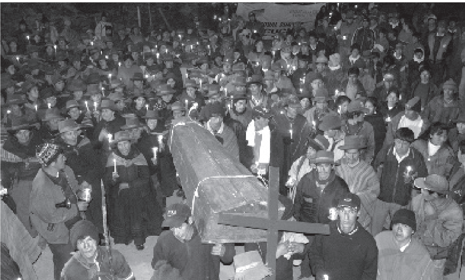
Comuneros de Chungui reciben a los miembros de la CVR antes del testimonio público impartido el 14 del 2002.

La CVR gana nuevamente un espacio en este proceso, cuando, un mes antes de la entrega del informe final, inauguró una muestra de fotos recolectadas entre más de 120 archivos que registraron la historia de los 20 años de conflicto armado interno agrupadas en 27 salas y ordenadas bajo el mismo esquema del proceso nacional de violencia que describe el informe final de la CVR. La exposición, titulada Yuyanapaq (Para Recordar) recibió más de 100 mil visitas en cuatro meses. La exposición –al igual que en su momento lo hicieron las AP-, volvió a colocar en el centro de la historia a las víctimas convirtiéndose también en una herramienta de impacto que moviliza la conciencia ciudadana.