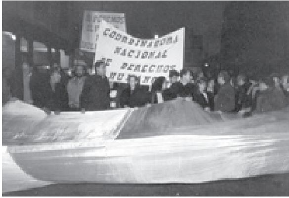
Marchas por la paz en los peores años del conflicto armado interno.

fortalecer procesos de articulación y diálogo con los sectores organizados de la sociedad civil. Aquí podemos señalar la creación y promoción de las Mesas de Trabajo sobre Derechos Económicos Sociales y Culturales, y la de No Discriminación; espacios de amplia convocatoria donde convergen instituciones de desarrollo, grupos feministas, pueblos indígenas, entre otros.