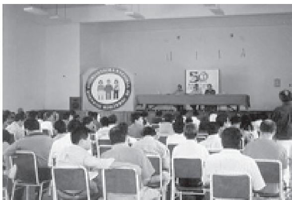
Los miembros de la CNDDHH se reúnen en Asamblea General cada dos años. 1997.

El trabajo se extendió hacia otras áreas geográficas para tener una presencia efectiva en los lugares donde se cometían atrocidades. Sin embargo, mantenerse en las zonas de emergencia implicaba ser sujetos de amenazas y rechazo, o ser catalogados como “defensores de terroristas”.