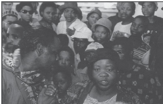
Testifier being supported by community briefer after giving testimony.

G tqt1 GB tjvK `Rb Zv`i Dcjwäi qigZv c0q nviZv etmQj wPiw`tbi Rb`| Zviv wUš-wbj TRC tZ ciw`b Zv`i