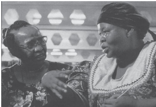
Commissioner listens while testifier prepares for testimony.

Ae`vUv Abpveb Kitjv Ges hveZxq wnsmv wet0tli Dta©Dtv Zviv GtK Actii mæúK hv tcvly KitZv gtb thUv Zv`i Agvbj KtiwQj | hLb GB c03b `Rb k1" 0Dc`eKvix 0 Ges 0Dc`*Z0 wntmte RuUj BwZnm `Zwi KitZ e"-wQj GKmgq - ZvivB GLb GKUv cZwK wbigq hvIvi mPbv Kitjv Ktqi tfZti mevi Rb`| hw`I hvIvUv LpB `Mg Zey GUv GKUv cwieZbi Rb` mthvMI Gtb w`tqtQ|