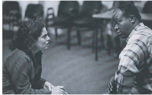
A one-on-one session between briefer and testifier

th AfbK mgq weđvi iv mnvqZv c0vbi Abjivta AwffZ ntq cotZv|