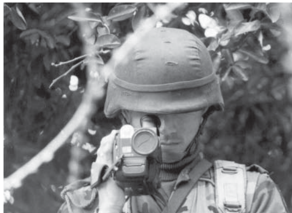
Militares filmando y fotografiando a defensores.

Durante un año, los miembros de la Red acudieron a San Cristóbal de Las Casas una semana cada mes, para recibir una capacitación intensiva tanto en la defensa de los derechos humanos como en la atención de asuntos penales incluyendo visitas a las diferentes instancias de defensa y de justicia que algunos de ellos habían conocido antes cuando acudieron en condición de víctimas. Fue menester, sin embargo, sentir y ver la realidad de su funcionamiento a partir de la gestión de sus propios casos.