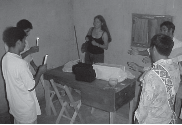
Oficina comunitaria de defensa de los DD. HH.

todo el proceso, incluso la defensa (en algunos casos bajo la orientación del asesor).