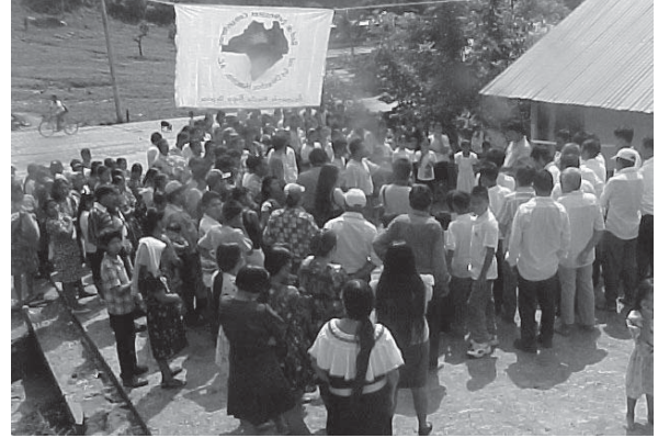
Inauguración de ceremonia religiosa tradicional en que se bendice el trabajo de los defensores.

humanos sean, en general, identificados con una de las partes en conflicto. En efecto, la defensa de los derechos humanos es vista como una acción de respaldo a quienes se han “rebelado” contra el gobierno para exigir sus derechos. En este escenario, la víctima resulta ser, por lo tanto, casi siempre un indígena.