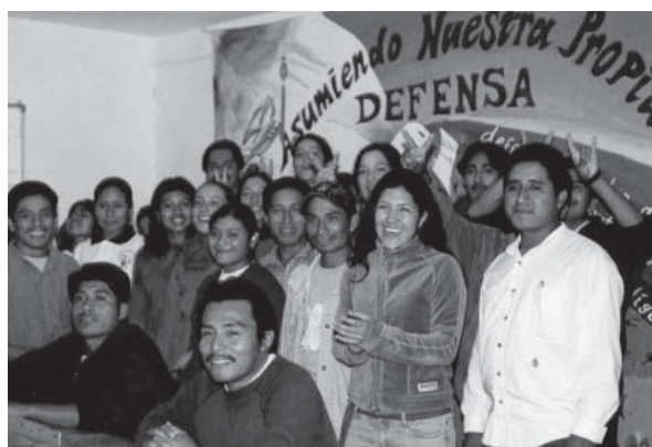
Los defensores en su formación y trabajo.

Su creación coincide con los últimos años de la década de los 80. El primero de ellos fue el Comité Diocesano de Ayuda a Inmigrantes Fronterizos (CODAIF) creado en 1986 por la Diócesis Católica de Tapachula. 12 Posteriormente, en 1989 fue creado el Centro de Derechos Humanos Fray Bartolomé de Las Casas, con el objetivo de defender los derechos individuales y colectivos de la comunidad, preferentemente de los pobres. 13 Sus fundadores fueron sacerdotes y religiosas, periodistas y otros profesionales que de manera individual venían trabajando en el servicio social. Posteriormente aparece el Centro de Derechos Indígenas, AC (CEDIAC), el Comité de Defensa de la Libertad Indígena de Palenque y el Centro de Derechos Humanos Fray Pedro Lorenzo de La Nada, entre otros. 14 La labor de los organismos no gubernamentales junto a otras expresiones organizadas de la sociedad civil, fue fundamental para frenar la guerra en 1994 y 1995. El trabajo