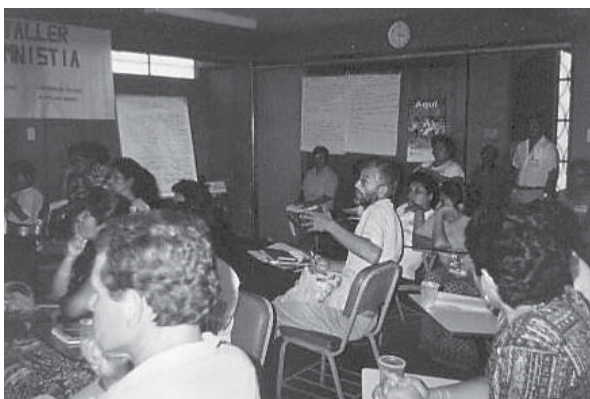
Los organismos miembros de la CNDDHH se reúnen y capacitan constantemente.