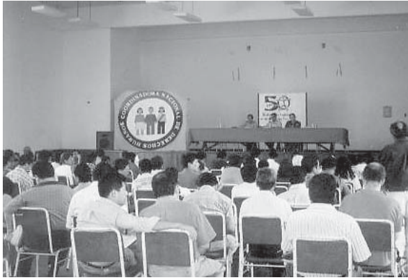
Los miembros de la CNDDHH se reúnen en Asamblea General cada dos años. 1997.

El trabajo se extendió hacia otras áreas geográficas para tener una presencia efectiva en los lugares donde se cometían atrocidades. Sin embargo, mantenerse en las zonas de emergencia implicaba ser sujetos de amenazas y rechazo, o ser catalogados como “defensores de terroristas”.