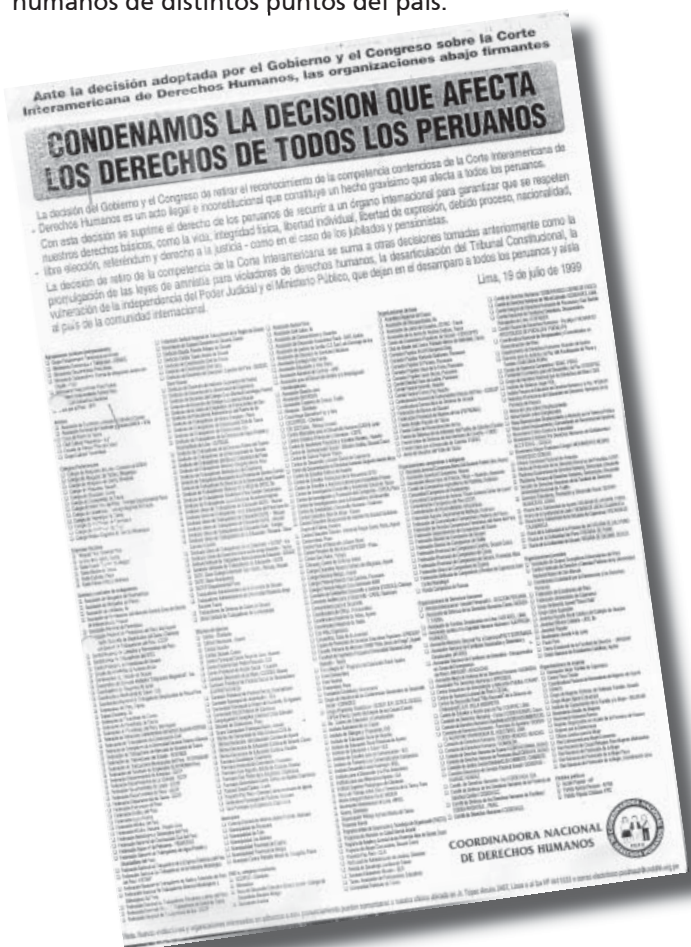
Movilizando a la sociedad civil: 400 organizaciones se pronuncian en contra del retiro del Perú de la CIDH.

Siempre ha sido muy arduo tratar de estrechar los vínculos entre las organizaciones de Lima y las de provincia, facilitar el diálogo, trabajar coordinadamente e intercambiar experiencias y capacidades. Por esa razón se han creado grupos de trabajo especializados e interdisciplinarios como el Grupo de Trabajo Jurídico y el Grupo de Trabajo sobre Reparaciones, los que convocan a profesionales de los organismos de derechos humanos de distintos puntos del país.