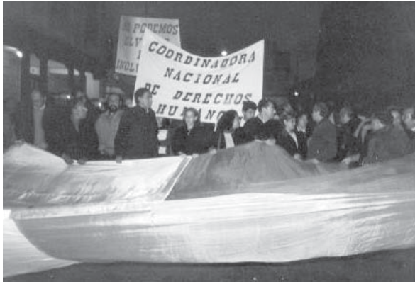
Marchas por la paz en los peores años del conflicto armado interno.

fortalecer procesos de articulación y diálogo con los sectores organizados de la sociedad civil. Aquí podemos señalar la creación y promoción de las Mesas de Trabajo sobre Derechos Económicos Sociales y Culturales, y la de No Discriminación; espacios de amplia convocatoria donde convergen instituciones de desarrollo, grupos feministas, pueblos indígenas, entre otros.