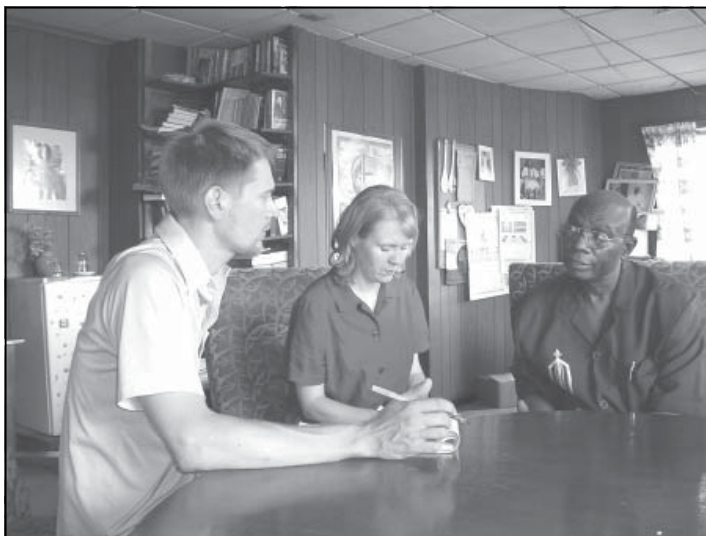
Учасники Minnesota Advocates проводять інтерв'ю з єпископом Хумпером, головою Комісії Правди і Примирення в Сьєрра-Леоне