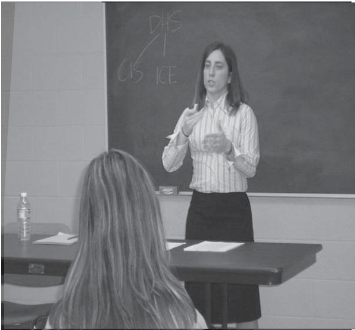
В рамках просвітньої і навчальної діяльності Проекту Документації Насилля Відносно Іммігранток діячі Minnesota Advocates провели навчання у галузі імміграційного права підчас Central Minnesota Conference on Domestic Violence and Immigration (квітень 2004 р.)

є продовження підтримки місцевих груп прав людини і співпраці з ними також після публікації звіту. Постійне