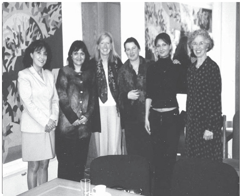
Команда і волонтерки Minnesota Advocates Women's Program з болгарськими діячками жіночих рухів і представницями влади.

Закон був прийнятий в першому читанні болгарським парламентом 30 червня 2004 р., друге читання передбачено восени 2004 р. Це є переломним досягненням для жінок в Болгарії і в цілому регіоні. Це також є прикладом як ефективного застосування моніторингу прав людини, так і успішної і результативної співпраці між діячами захисту прав людини з різних країн. Для однієї з волонтерок Minnesota Advocates , задіяної в цьому проекті, робота, пов'язана з проблемою домашнього насильства в Болгарії, мала особливе особисте значення, пов'язане із спогадами з минулого. Майже три декади раніше вона працювала над впровадженням положень про судові рішення захисту в штаті Міннесота, - другому за розміром штаті в США. «Так, безліч речей, що мають тепер місце в Болгарії, відбулося в