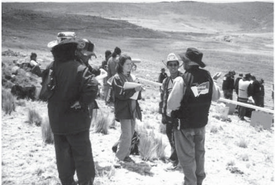
Волонтерка Minnesota Advocates спостерігає за виконуваною через Комісію Правди і Примирення у рамках її дій ексгумацією масових поховань в Луканамарка, Перу.

Заключний звіт Minnesota Advocates на тему роботи TRC в Перу буде опублікований в кінці 2004 р. Письмовий звіт, що аналізує хід робіт TRC в контексті міжнародних стандартів прав людини, детально описував положення, пов'язані з