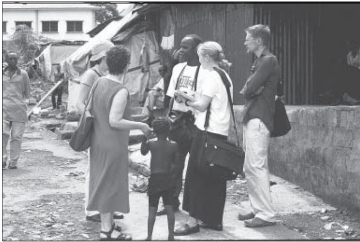
Команда і волонтери Minnesota Advocates проводять інтерв'ю у Фритаун, Сьєрра Леоне.