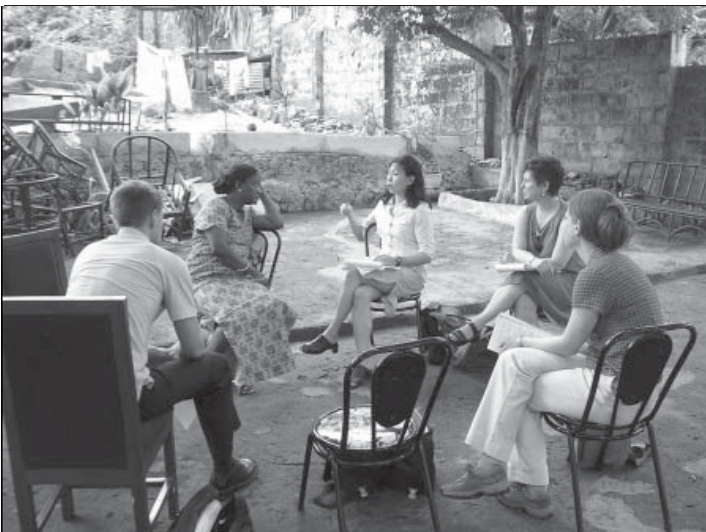
Команда Minnesota Advocates проводить дослідження умов, які панують в центрі для жертв каліцтва в Сьєрра-Леоне

його роботи, і положення, що стосуються вибраних проблем прав людини. Звіт міститиме рекомендації для перуанського уряду, середовища неурядових організацій і інших учасників процесу.